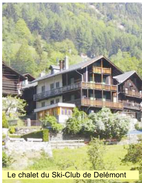
Le chalet du Ski-Club de Delémont

• Equipement : Vérifier à l'avance l'état des snowboards ou des skis ainsi que l'ajustement et la position des fixations. Le port du casque est obligatoire pour tous , celui de protège-poignets pour les snowboarders est vivement recommandé.